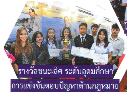
รางวัลชนะเลิศ ระดับอุดมศึกษา การแข่งขันตอบปัญหาด้านกฎหมาย