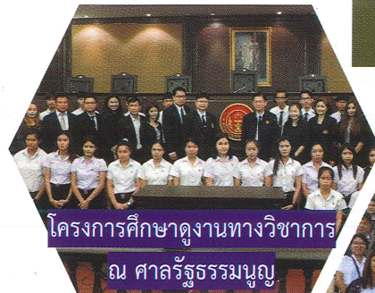
โครงการศึกษาดูงานทางวิชาการ ณ ศาลรัฐธรรมนูญ