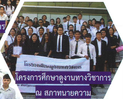
โครงการศึกษาดูงานทางวิชาการ ณ สถานทูตเยอรมนี