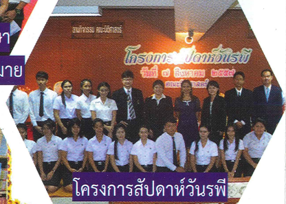
โครงการสัปดาห์วันพี