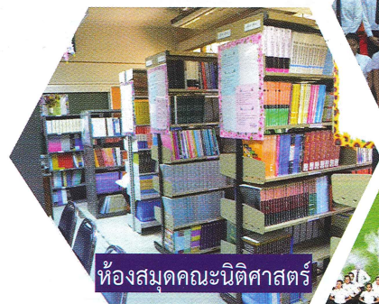
ห้องสมุดคณะนิติศาสตร์