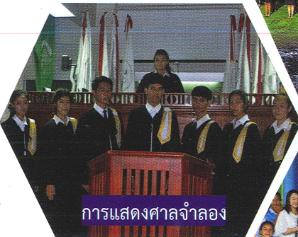
การแสดงศาลจำลอง