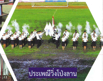
ประเพณีวิ่งโป่งลาน