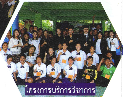
โครงการบริการวิชาการ